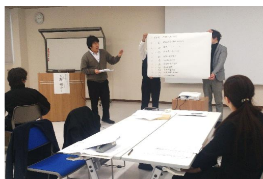
グループで話し合っただけ決めた仕事の優先順位の発表