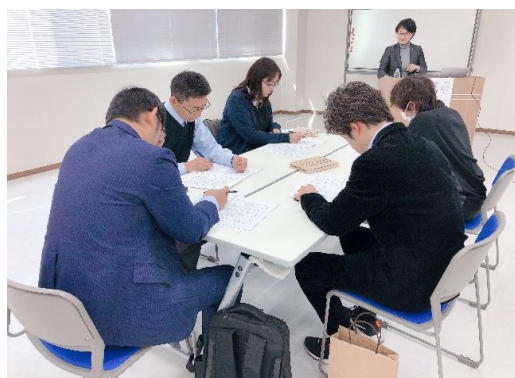
真剣に考える受講者たち

研修の進行はグループワークがメインですが、話し合いのルールが決められていたので、初めての人でもなんとなくグループワークを廻すことができました。普段はあまり深く考えていなかった仕事の時間管理について書いたり話したりすることによって、より理解が深まり、また、他部署の人と話すことにより新たな発見など「気づき」がありました。